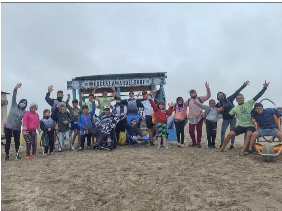
Imagen 1. Escuela MardelSurf en Puerto Cardiel, Mar del Plata

Para favorecer la comprensión del contexto de investigación, se consideró necesario graficar, a través de imágenes, la Escuela MardelSurf y los dispositivos que en la misma se utilizan para la práctica de surf adaptado.