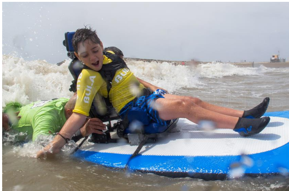
Imagen 4 y 5. Tabla con silla postural