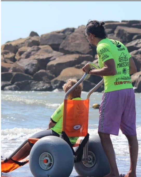
Imagen 6. Silla anfibia utilizada en la Escuela MardelSurf