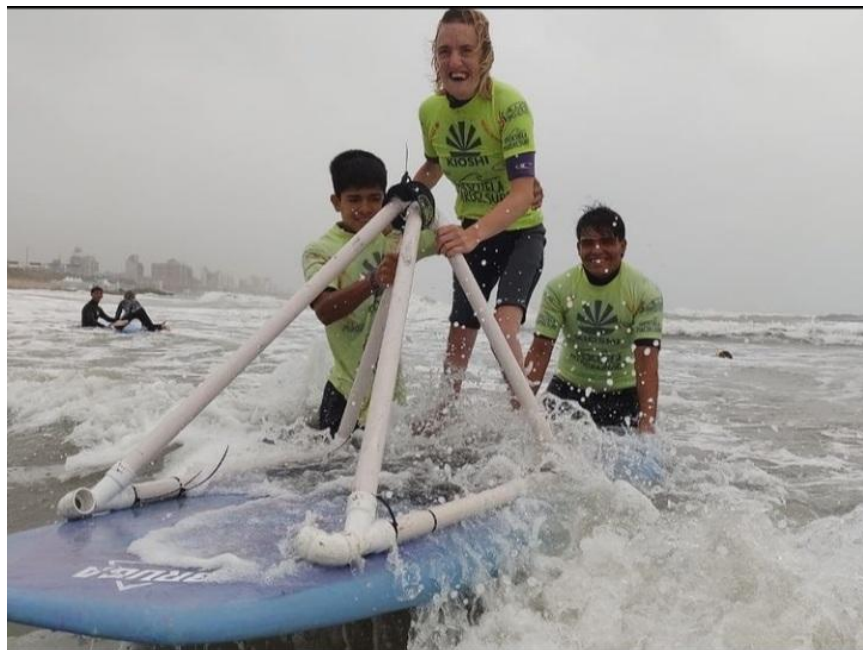
Imagen 2 y 3. Tabla con adaptación realizada en PVC