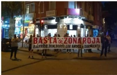
Ilustración 3 Ilustración 3 https://ahoramardelplata.com.ar/el-inadi-se-opuso-al-traslado-la-zona-roja-mar-del-plata-n4232266