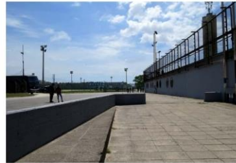
La calle Canosa es el espacio propuesto por el oficialismo para trasladar la "Zona roja"

El oficialismo presentó un expediente en el Concejo para trasladarla a la zona del estadio Minella, en tanto que desde Acción Marplatense lo criticaron y elevaron otro.