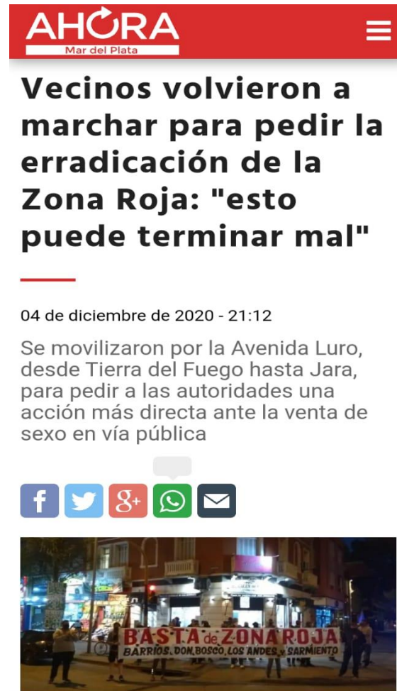
Ilustración 2 https://ahoramardelplata.com.ar/vecinos-volvieron-marchar-pedir-la-erradicacion-la-zona-roja-esto-puede-terminar-mal-n4222315

Ilustración 1 https://quedigital.com.ar/sociedad/vecinos-de-distintos-barrios-tambien-se-oponen-al-traslado-de-la-zona-roja/