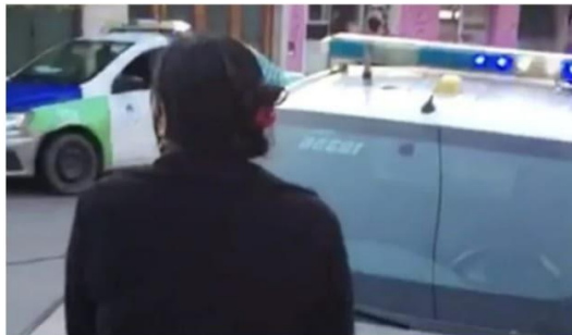
Ilustración 5 https://ahoramardelplata.com.ar/video-la-reaccion-los-vecinos-la-detencion-una-trans-plena-protesta-n4222025