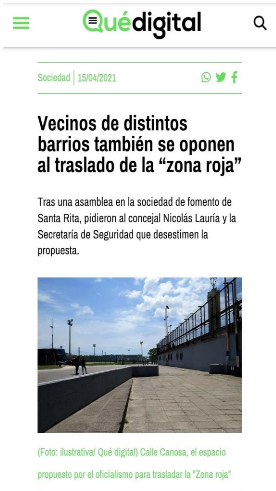
Ilustración 1 https://quedigital.com.ar/sociedad/vecinos-de-distintos-barrios-tambien-se-oponen-al-traslado-de-la-zona-roja/