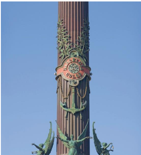
Figura 2: Monumento a Colón, imagen extraída (URL) https://hashmuseum.com/es/coleccion/colon-y-el-cannabis