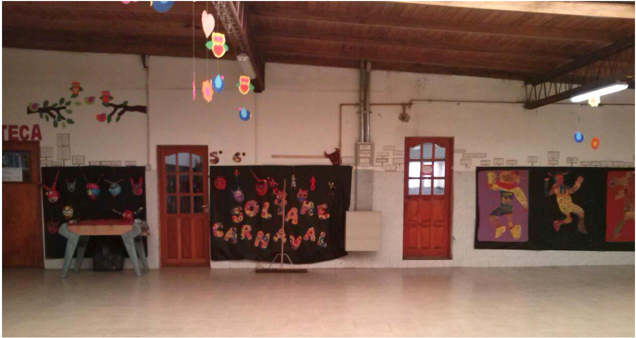
C Producciones de la semana del arte expuestas por quinto y sexto grado