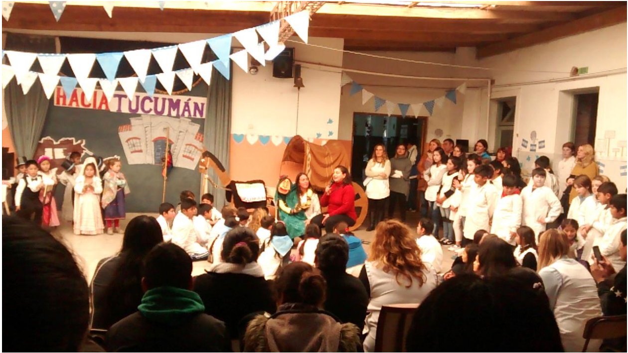
J Participación de una mamá de los alumnos en el acto del Día de la Independencia