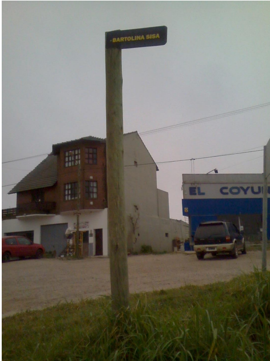
E Denominación de las calles según el proyecto de la EP N8