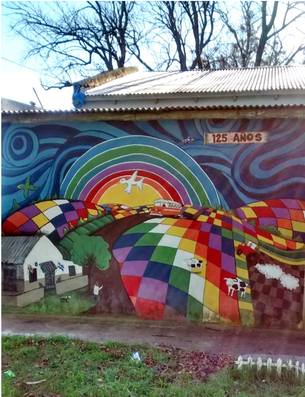
A Mural externo