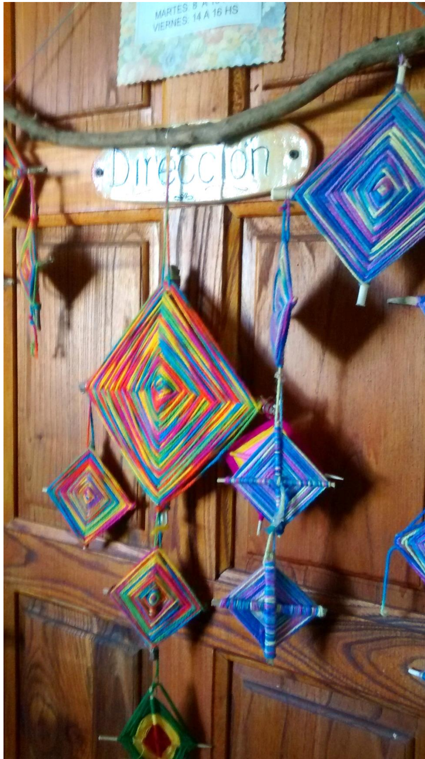
F Algunas de las alasitas elaboradas por los alumnos que se encuentran dispersas por la institución