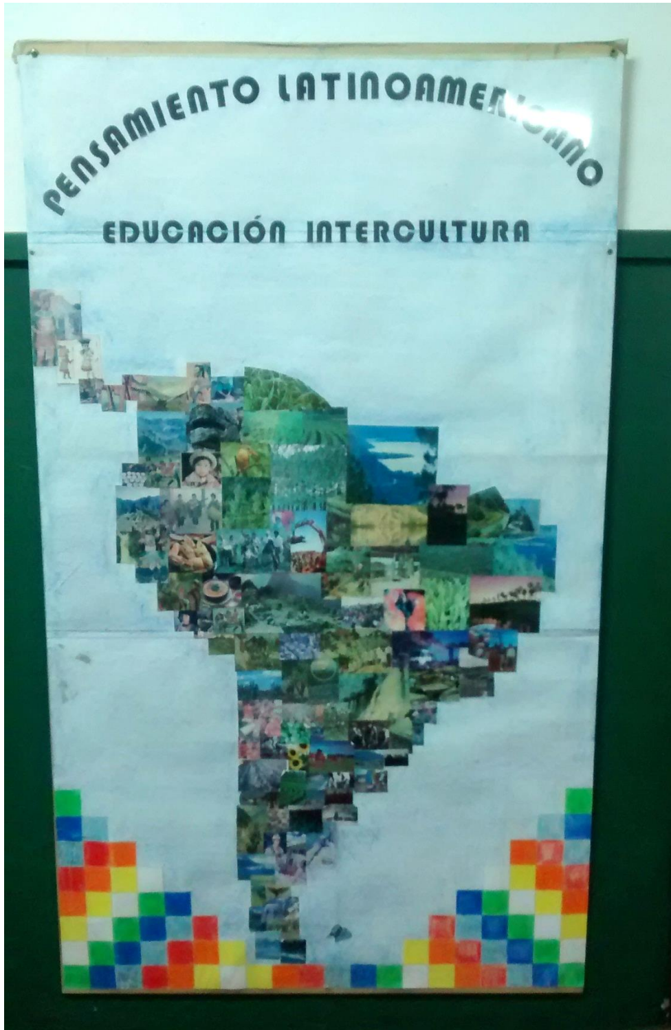
B Cuadro realizado por los alumnos de la institución