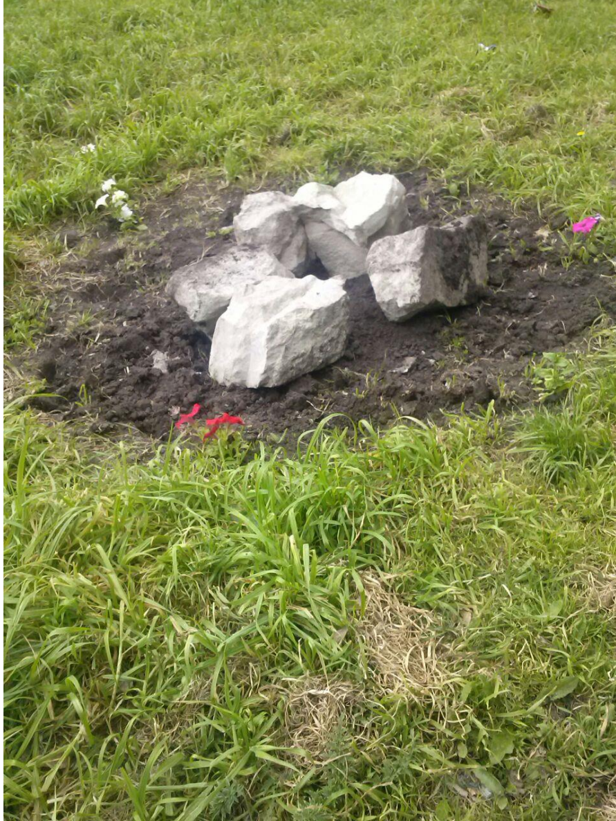
H Apacheta ubicada en el parque de la escuela