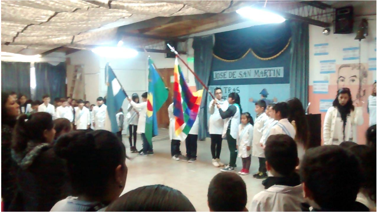
G Cordón de bandera. En este caso la fotografía fue tomada durante uno de los actos escolares