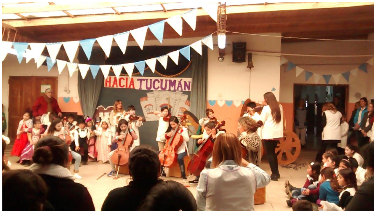
I Intervención del ensamble de violonchelos y violines formado por los alumnos de EP N8