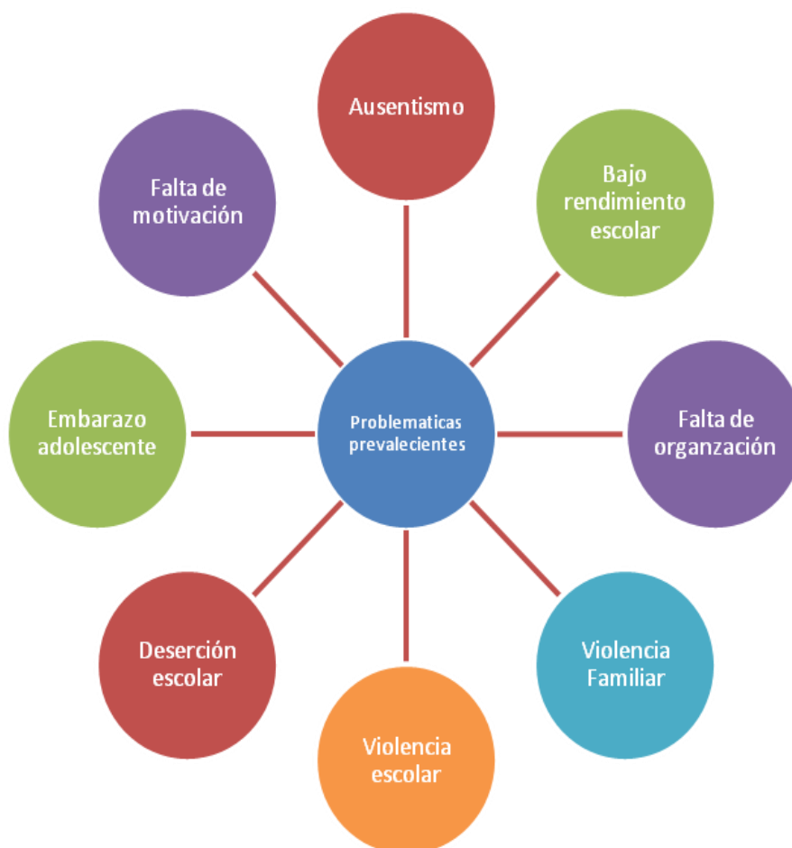
Gráfico 2: Problemáticas prevalentes

Un aspecto a destacar con respecto a las problemáticas prevalentes, fue el hecho de que todas las entrevistadas nombraron el ausentismo, lo que remitiría a la función histórica de la escuela como institución de control y de normalización.