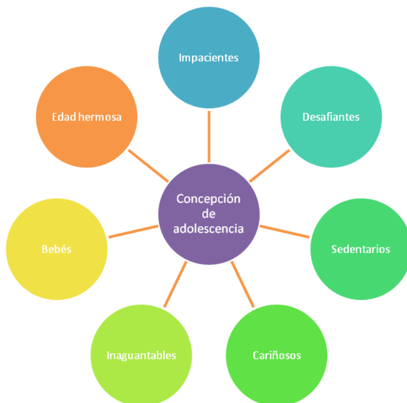
Gráfico 3: Concepción de la adolescencia

Al respecto, una de las entrevistadas plantea lo siguiente: