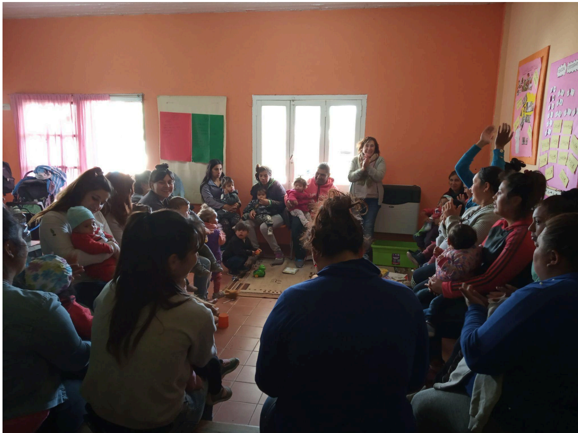
Mujeres y niños/as participantes del Taller de Estimulación Temprana del barrio Las Heras. Año 2019.