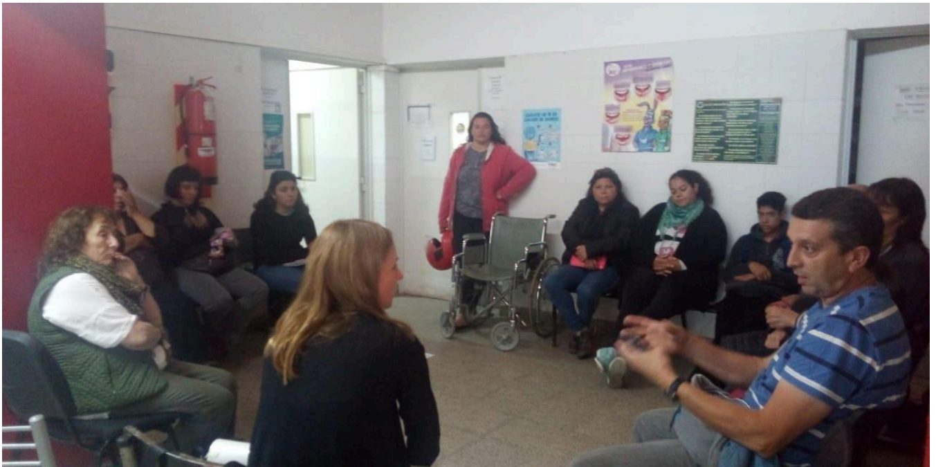
Reunión comunitaria en CAPS Parque Hermoso por el acceso a agua potable. Noviembre 2019.