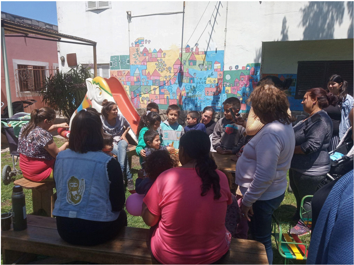
Mujeres y niños/as participantes del Taller de Estimulación Temprana del barrio Las Heras. Año 2019.