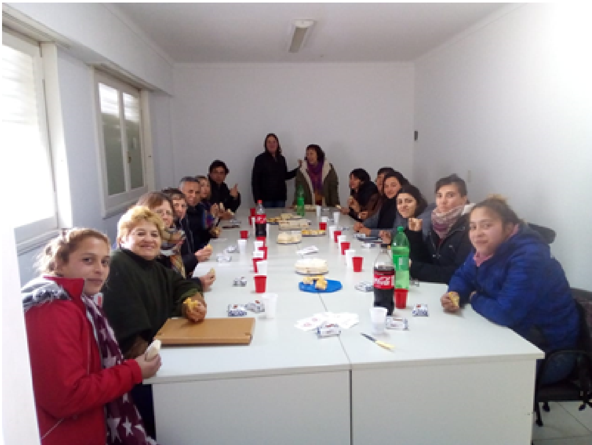
Equipo de trabajo del Proyecto Betania (2019-2020)