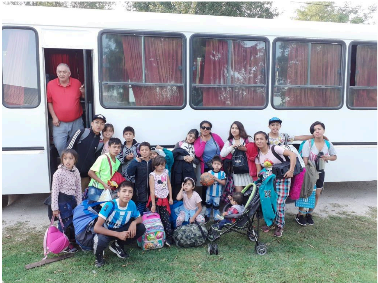
Salida del grupo de Parque Hermoso hacia la Unidad Turística de Chapadmalal en Marzo 2020