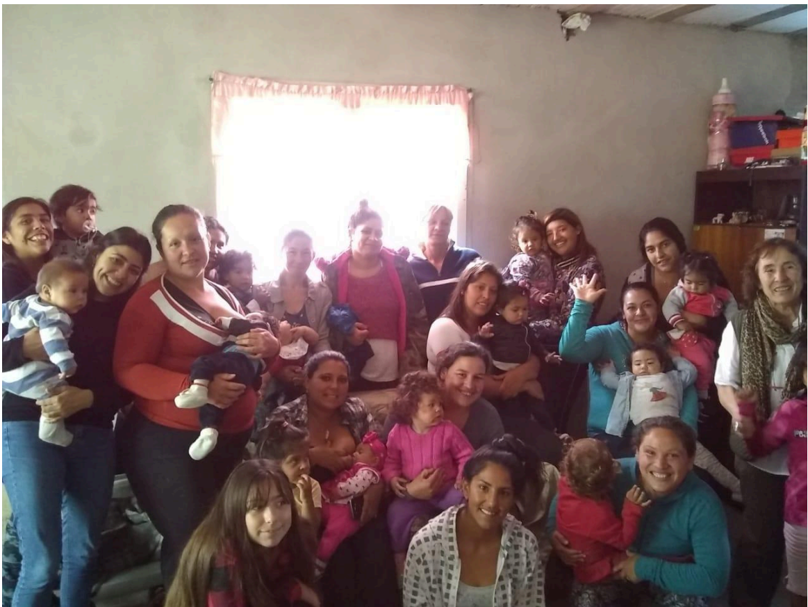
Taller de Estimulación Temprana en la "inauguración" de la casa que autoconstruyó una de las mujeres participantes del barrio Las Heras. Año 2019.