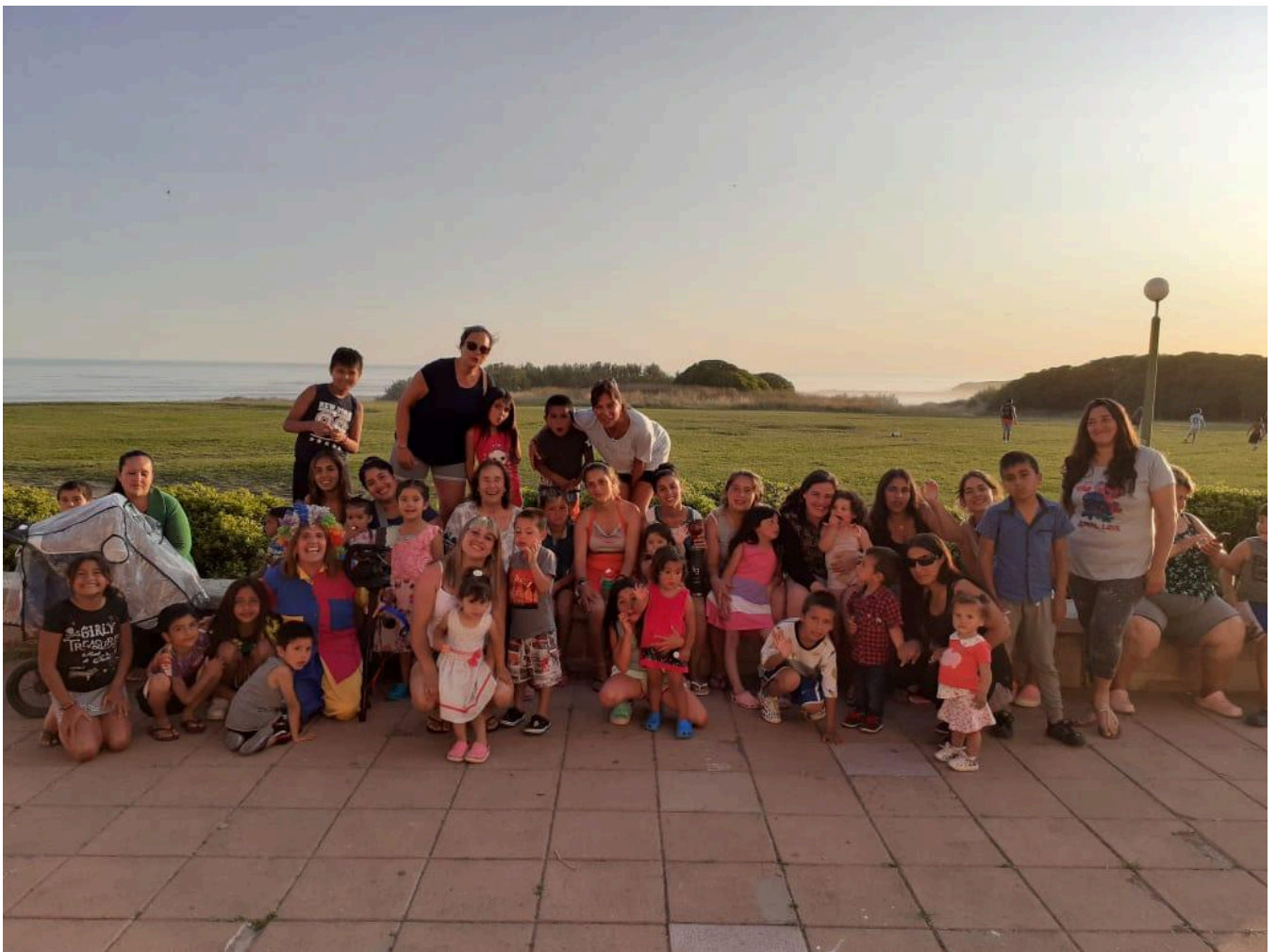
Ida a la Unidad Turística de Chapadmalal en Enero 2020