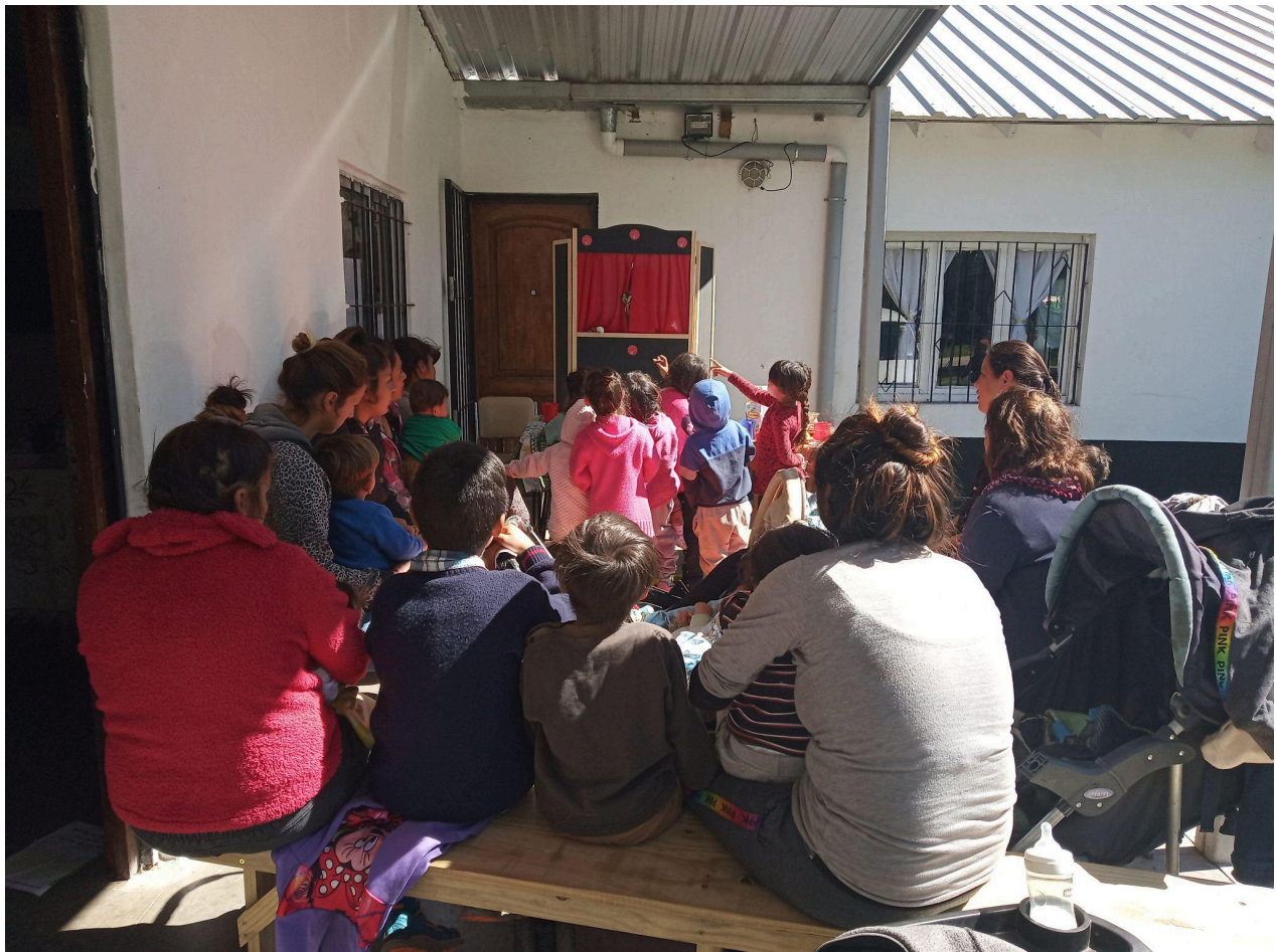
Mujeres y niños/as participantes del Taller de Estimulación Temprana del barrio Parque Hermoso. Año 2019.