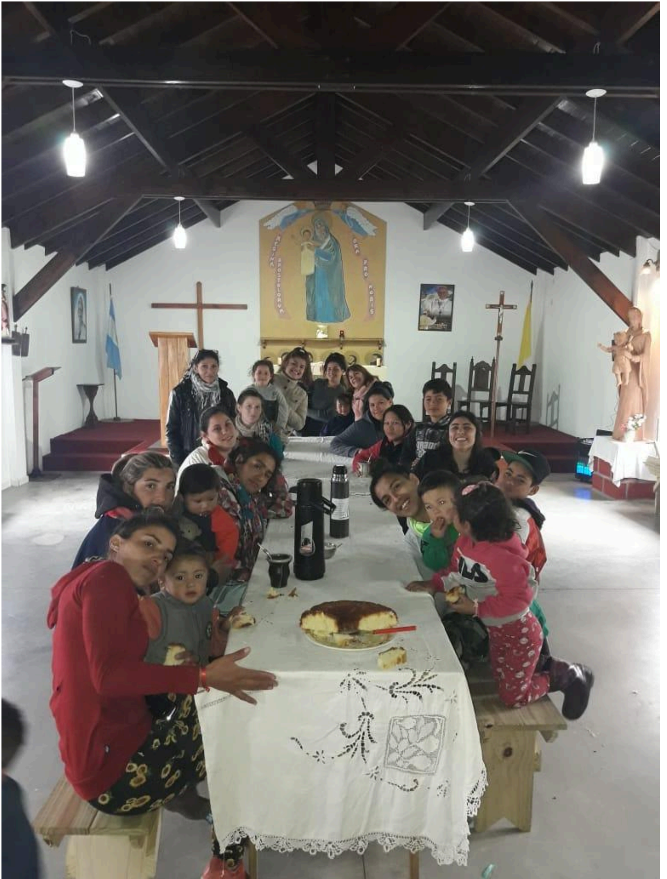
Mujeres y niños/as participantes del Taller de Estimulación Temprana del barrio Parque Hermoso. Año 2019.