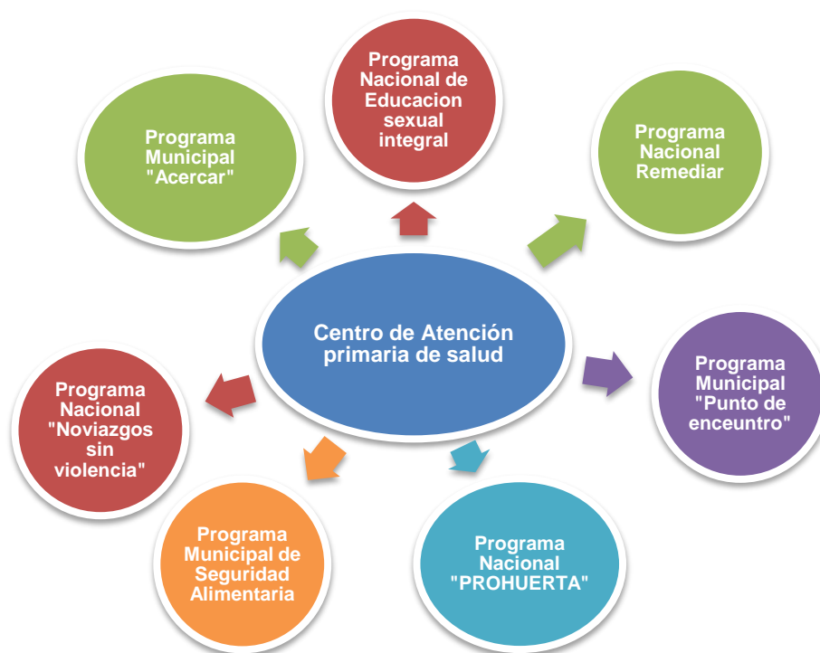
Gráfico 5: Programas y proyectos

Fuente 5: Elaboración propia en base a entrevistas realizadas