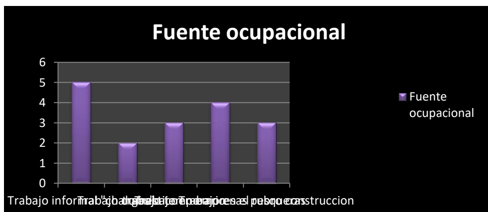
Gráfico 3: Fuente ocupacional

Con el objetivo de aproximarse a la situación de accesibilidad a la salud pública, éste estudio consideró importante caracterizar, a través de rasgos generales, a la población que concurre a los centros de atención primaria entrevistados. Para ello se propusieron una serie de ítems que guiaron a los profesionales durante la entrevista en esta dirección.