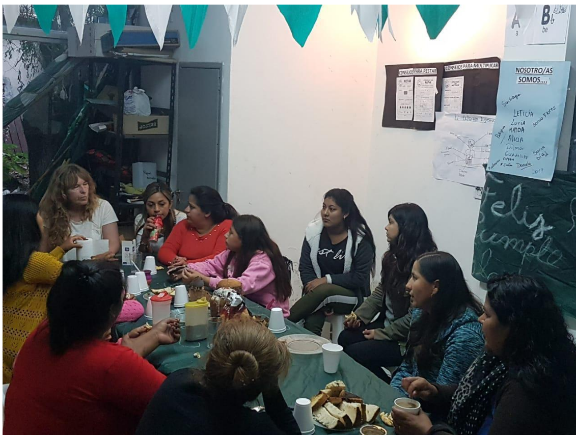
Foto de una de las reuniones mensuales de productoras en la sede de Batán.

promocionar la agroecología, recuperar la Soberanía Alimentaria de los productores familiares y promocionar la importancia del cuidado la salud dentro de la Agricultura Familiar, tanto de los trabajadorxs, como de la población que consume los alimentos.