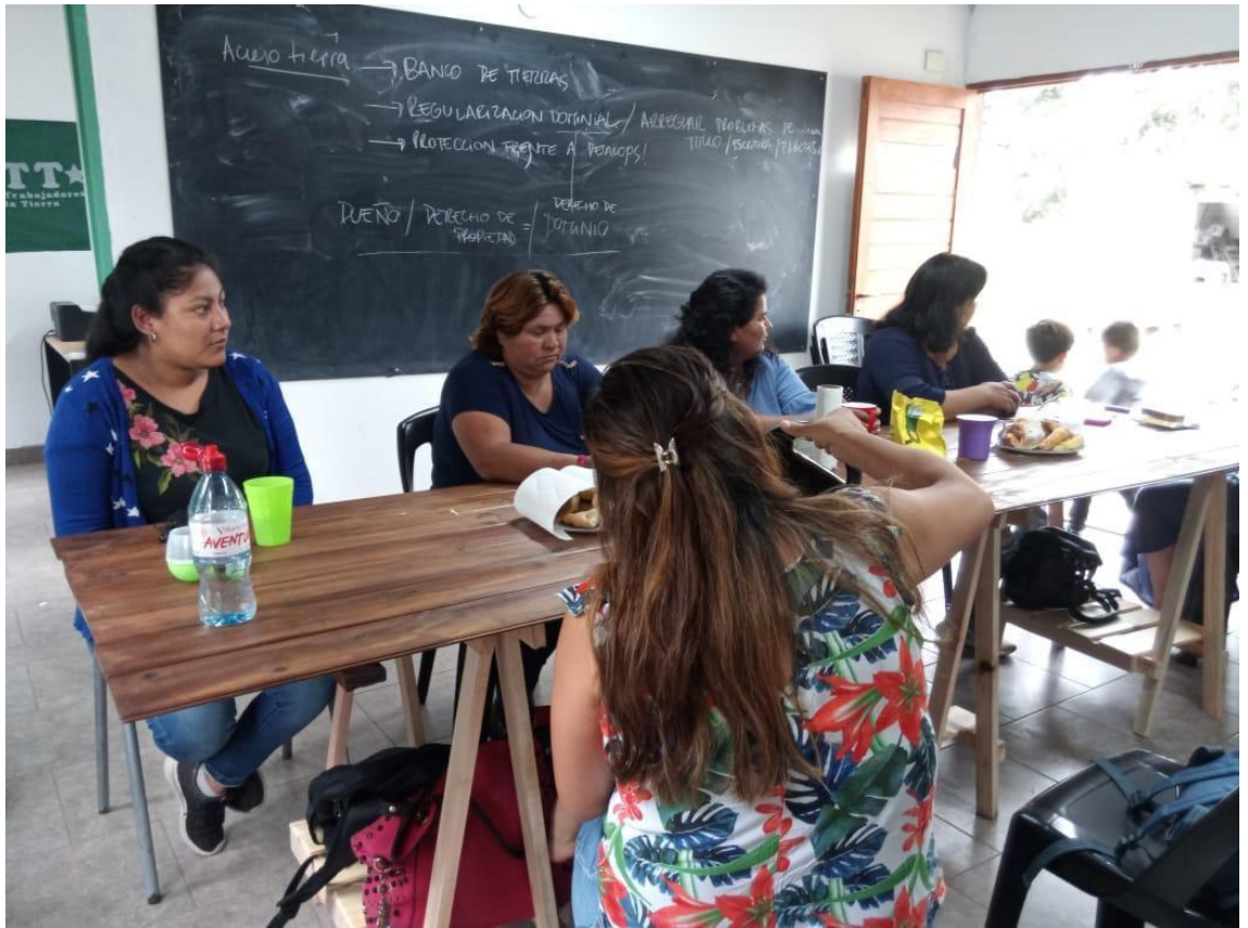
Foto tomada por la autora de unos de los encuentros mensuales de las promotoras.