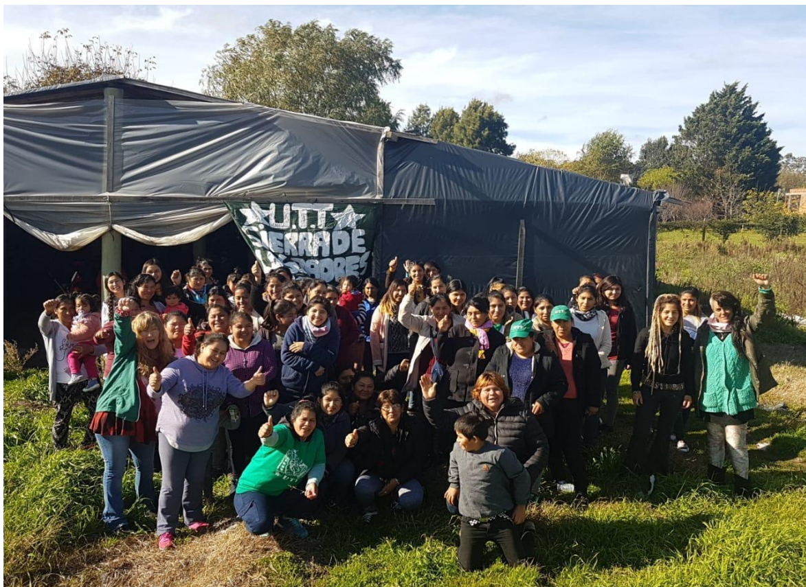
Foto del Primer encuentro de mujeres productoras de la UTT MDP, en la base territorial de Sierra de los Padres, mayo 2018.

relaciones patriarcales, entre lo público y lo privado, entre lo masculino y lo femenino, a partir de la construcción de un dispositivo grupal propio de, y para con ELLAS .