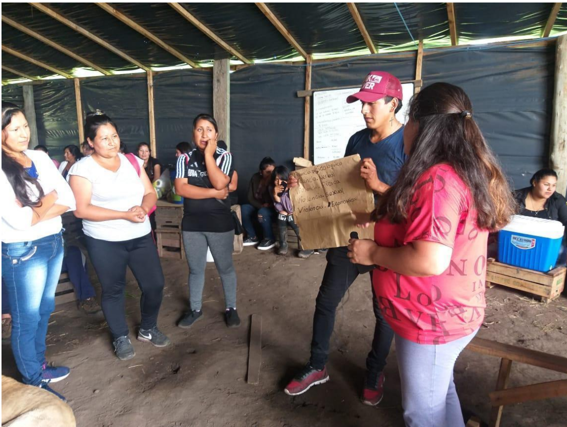
Foto de una de las intervenciones de las promotoras de género en la Asamblea de base junto a los participantes varones.

el espacio taller fue encontrando su esencia, horizonte y línea de trabajo.