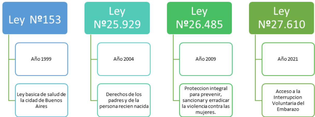
GRÁFICO N°1: MARCO NORMATIVO