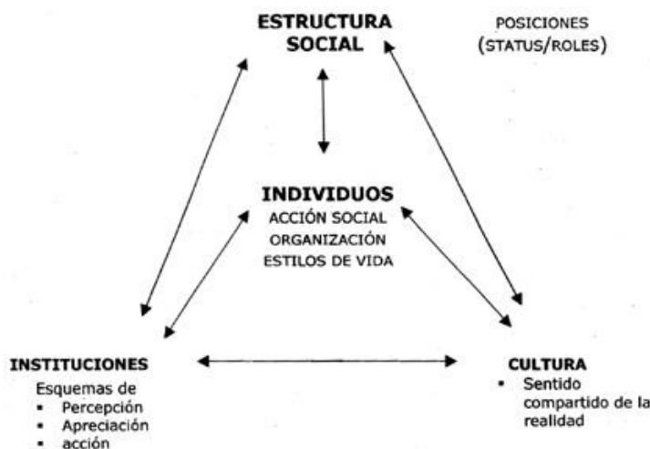
Esquema que relaciona La estructura social, La cultura y las instituciones.

El siguiente esquema tomado de Torraza (2000), relaciona la estructura social, la cultura y las instituciones. En el lugar central de este esbozo, como mediadores de aquellos tres ámbitos, como sus actores y sus constructores, situamos a los individuos.