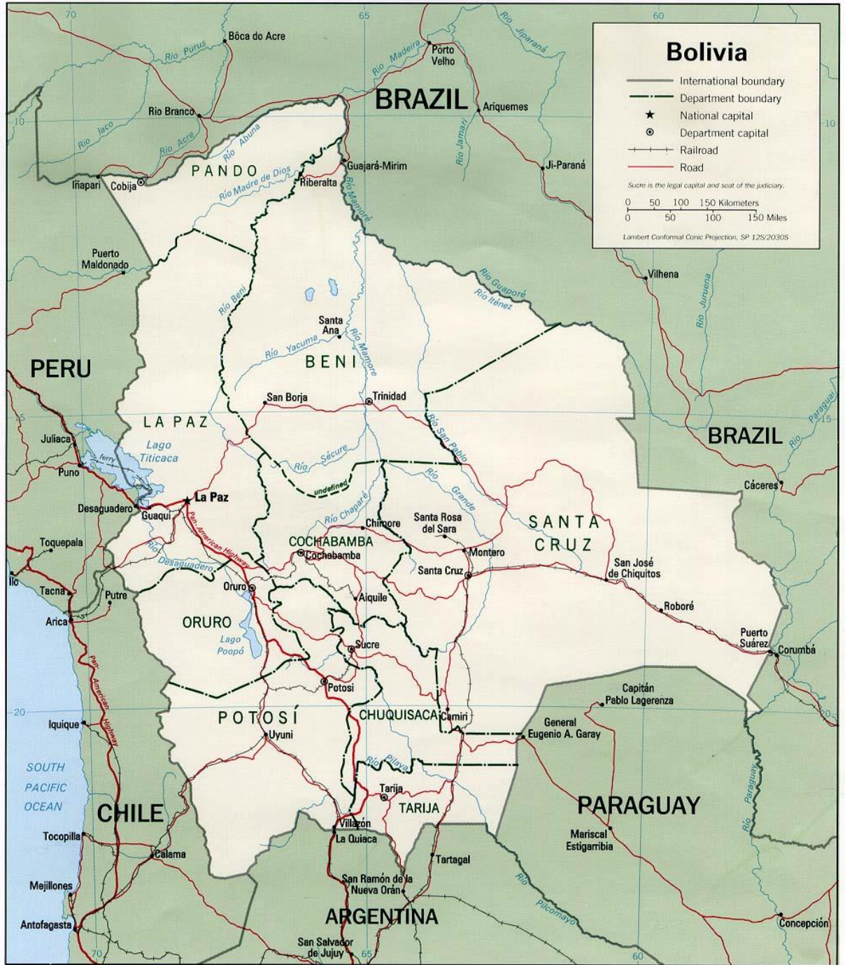
Base 802148 (R00815) 11-93