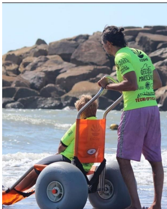
Imagen 6. Silla anfibia utilizada en la Escuela MardelSurf