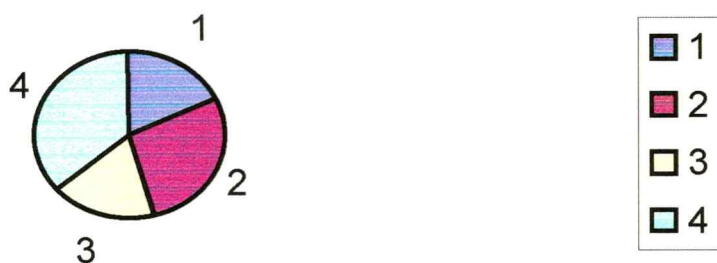
Gráfico I Distribución de la muestra según tipo de actitud familiar