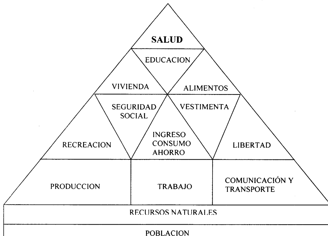
Esquema N ° 1: Componentes de Bienestar. Naciones Unidas 1961.

la pirámide que reúne los componentes del mismo propuestos por las Naciones Unidas en 1961 a fin de establecer la relación de cada uno de ellos con la salud.