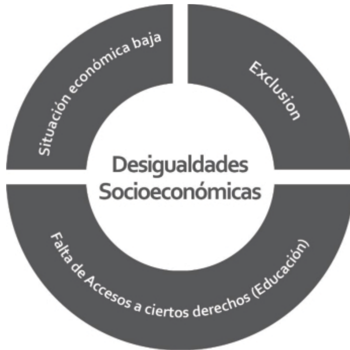
Gráfico N°2 Desigualdades Socioeconómicas