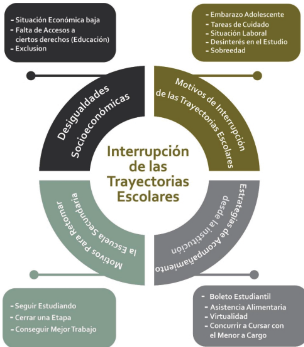
Gráfico 6: Variables analizadas con sus respectivas sub-variables