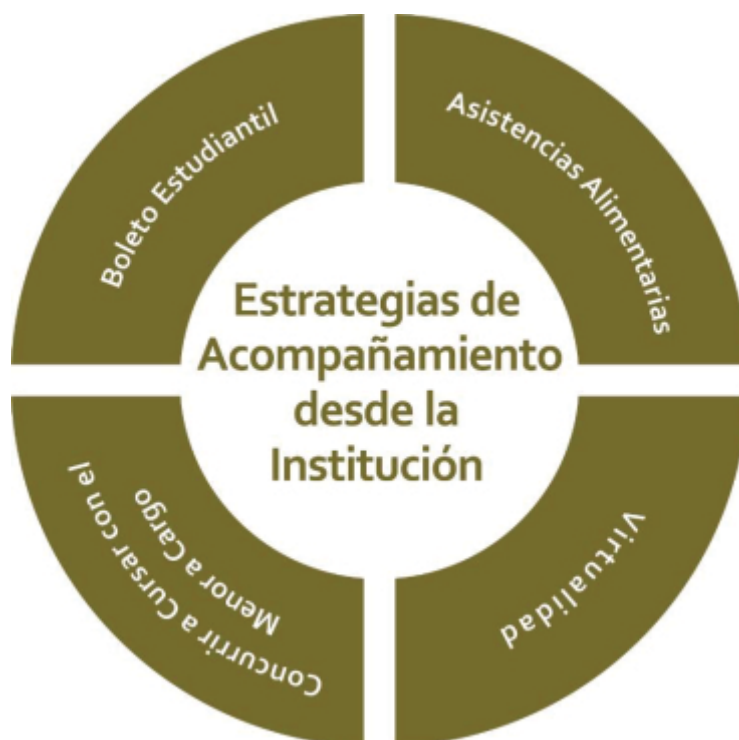
Gráfico 5: Estrategias de acompañamiento desde la Institución