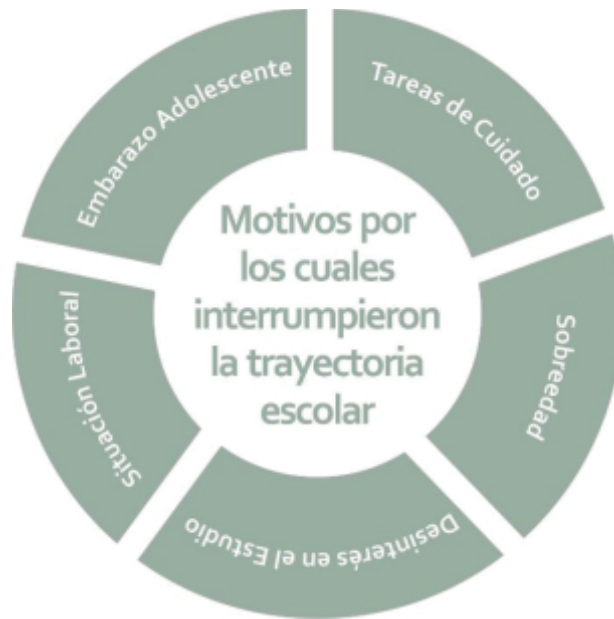
Gráfico 3: Motivos por los cuales interrumpieron la trayectoria escolar