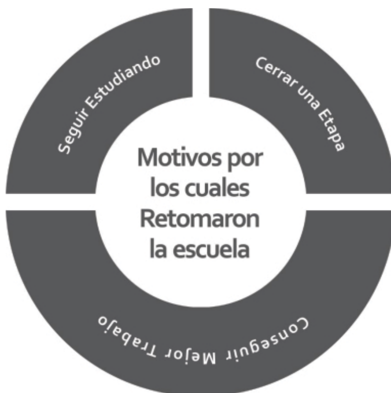
Gráfico 4: Motivos por los cuales Retomaron la escuela