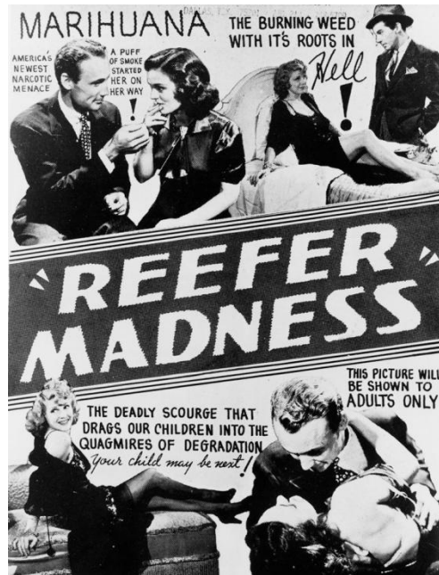
Figura 3. Publicidad de la década de los treinta haciendo referencia a 'reefermadness'

En 1937, el Congreso estadounidense, en contra del consejo de la Asociación Médica Americana, aprobó la Ley del Impuesto sobre la Marihuana, haciéndola costosa y difícil de obtener. Así, por presión norteamericana, también se implementó en México.