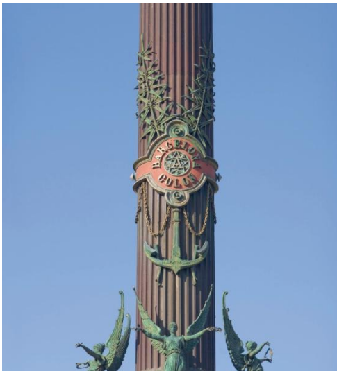
Figura 2: Monumento a Colón, imagen extraída (URL) https://hashmuseum.com/es/coleccion/colon-y-el-cannabis